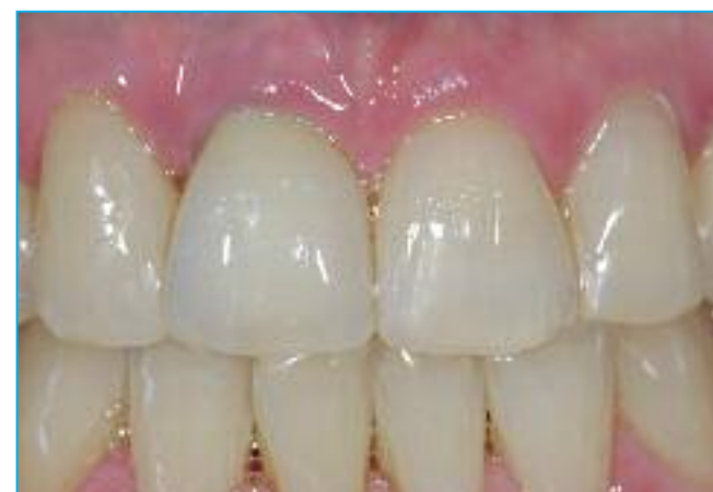
Abb. 4: Sehr ansprechende prothetische Versorgung am Zahn 11

höhe, umfangreiche Versorgungsoptionen und eine tadellos strukturierte Oberfläche (BDIZ-Studie, Köln). Die Implantat-Philosophie wird durch eine minimierte Anzahl von Komponenten unterstützt. Die Implantatinsertion gestaltet sich daher sehr einfach und führt zu sehr guten und langzeitstabilen Ergebnissen. Die Versorgungsqualität ist charakterisiert durch die Berücksichtigung der Biologischen Breite und kann selbst höchsten Ansprüchen genügen.