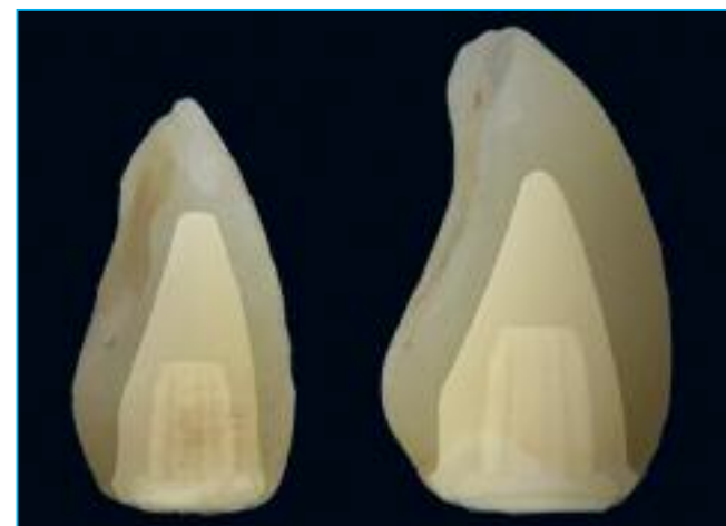
Abb. 3: Vorgefertigte Zirkonoxidkappen bei optimierter Schichtbildung der Verblendkeramik

Das Aesthura-Immediate-Implantat (Hersteller Nemris), das wir in diesem Zusammenhang bevorzugt einsetzen (da es auf die TMC-Philosophie perfekt abgestimmt ist), weist spezielle konstruktive Charakteristika auf. Es besitzt eine exakt definierte prothetische Basis, ein hochretentives, hochbelastbares, trajektorieell aufgebautes Retentionselement mit großer Oberfläche, aber von geringer Bau-