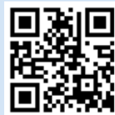
Broschüre Kompass Stiftsysteme