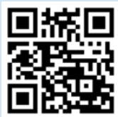
Broschüre DentinPost X Coated