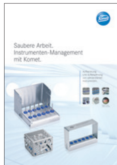
Abb. 2: Instrumentenmanagement auf einen Blick

Oralchirurgen benötigen andere Instrumentenständer als allgemein tätige Kollegen, Kliniken arbeiten mit anderen Umfängen als Praxiszahnärzte. Während früher auf großen Instrumentenständern 30 und mehr Instrumente Platz fanden (die allesamt wieder aufbereitet werden mussten, weil möglicherweise Aerosol-belastet) hat Komet den Trend hin zu kleineren, hoch individuellen Sets losgetreten. Ein breites Angebot an Instrumentenständern erlaubt nun ein vernünftiges Abwägen zwischen Wirtschaftlichkeit und Sicherheit: groß, klein, hoch, tief, für die Prophylaxe, die Endodontie, für Schallspitzen und vieles mehr.