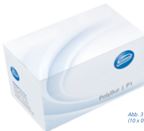
Abb. 3 PolyBur-Startset 4608 mit 25 Instrumenten (10 x 014, 10 x 018 und 5 x 023)