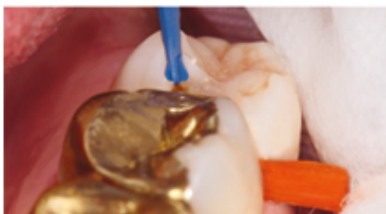
Abb. 1 Pulpanahes Exkavieren mit dem PolyBur

Die selbstlimitierende Exkavationsmethode mit dem Polymerbohrer PolyBur P1 erlebt eine neue Flut des Interesses. Zentral und pulpanah eingesetzt, erhält er wertvolle Zahnschubstanz, indem seine Schneiden auf hartem, demineralisiertem Dentin verrunden.