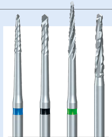
Abb. 2: Vier Knochenfräser für alle Knochen bearbeitenden Maßnahmen – in der MKG-Chirurgie auch als ideale Ergänzung zu chirurgischen Rundkopfborschern.

Komet hat sich Wissen und Erfahrung aus seinem Medical-Bereich zunutzen gemacht und eine Schneidengeometrie für die Schädelknochenpräparation erfolgreich auf ein rotierendes Hartmetallinstrument für die Oralchirurgie übertragen. Das Ergebnis heißt ST-Verzahnung, die sprichwörtliche säbelzahn timerscharfe Verzahnung. Der H162ST bietet höchste Schnittschärfe, perfektes Schneidverhalten und maximale Kontrolle. Typische Indikationen sind unter anderem Knochnerschnitte im Rahmen einer Osteotomie, Osteoplastik, Präparation von