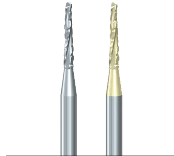
Abb. 3: H162ST und STZ: höchste Schnittschärfe erbringt viel Zeitersparnis.