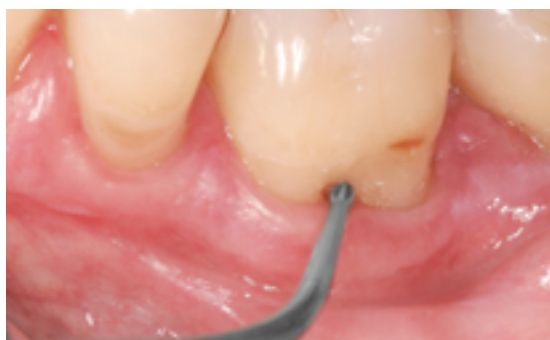
Abb. 2: Das verzahnte Instrument SF11 kann zur Erweiterung des Furkationseingangs eingesetzt werden und optimiert somit die Hygienebedingungen.

Die Paro-Stars können wie alle SonicLine-Spitzen im Thermodesinfektor unter Verwendung eines Spülsiebtes aufbereitet werden. Dabei werden sie aber nicht von innen gereinigt. Die Lösung: Komet, einziger Anbieter einer validierten maschinellen Aufbereitungsempfehlung, hat auch den Spüladapter SF1978 im Programm. Er erhöht die Lebensdauer des Schall/Ultraschallinstrumentes und vermeidet Innenkorrosion. Besonders praktisch sind außerdem die Steri-Kassetten 9952 für Schallspitzen. Die Ständer nehmen die Spitzen in sieben vormontierten hellblauen Silikonstopfen auf. Dadurch bleibt selbst in Seitenlage alles schön geordnet und es entstehen keine Spülschatten. Das perfektioniert die Praxisabläufe.