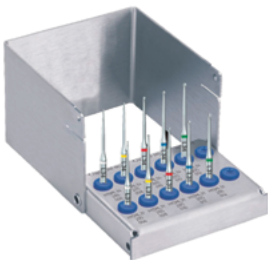
Abb. 1: EndoTracer Set – ideal zum Kennenlernen und Ausprobieren

Der EndoTracer ist ein graziler Rosenbohrer für die Präparation der endodontischen Zugangskavität. Mit ihm steht ein Spezialist für die Isthmus-Präparation zur Verfügung.