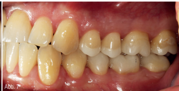
Abb. 6 und 7: Lateralansicht. Abb. 8 bis 10: Mock-up OK-Front.

lenke, unauffällige Öffnungs- und Schließbewegung, keine Druckdolenz der Muskulatur bei Palpation. Gelegentliche leichte Kopfschmerzen.