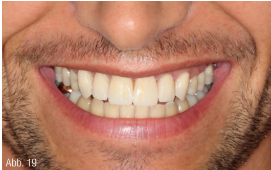
Abb. 18 und 19: Eingliederung der definitiven Versorgung im OK.

getränkten (Racestypine solution, Septodont) Fadens (Ultrapak 0, Ultradent), über welchen ein zweiter getränkter Faden größeren Durchmessers gelegt wird (Ultrapak 1, Ultradent). Wartezeit bis zur Abdrucknahme mit den gelegten Fäden etwa 10 Minuten. Die Abdrucknahme erfolgt nach Entfernung des zuletzt gelegten Fadens (der zuerst gelegte Faden geringeren Durchmessers verbleibt im Sulcus) mittels eines A-Silikons in Doppelmischtechnik einzeitig: Umspritzung der präparierten Zähne mit dünnfließendem Material (Express Ultra-Light Body, 3M ESPE) und Einbringen des schwerfließenden Materials, (Express Penta Putty, 3M ESPE) in einen Abdrucklöffel (Rim Lock, DeTrey).