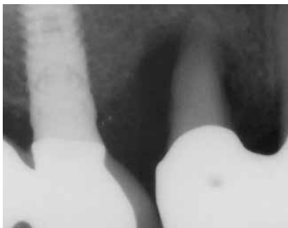
Abb. 2: Der Röntgenbefund zeigt den bis zum Apex reichenden Knochendefekt an Zahn 14.

Im Zuge der Defektauffüllung wurden Schmelzmatrixproteine in Kombination mit einem Knochenersatzmaterial eingebracht. Nach der Reinigung mit Pref-Gel® (Straumann) wurden zunächst Schmelzmatrixproteine (Emdogain®, Straumann) auf die