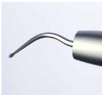
Abb. 5: Knospenförmiger Schallansatz SF11 zum Reinigen der Furkations- und Invaginationsbereiche.