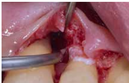
Abb. 14: Reinigung der Wurzeloberfläche mit schmalen, schallaktivierten Instrumenten.