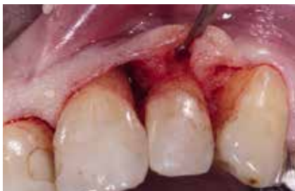
Abb. 13: Darstellung des vertikalen Defekts.

Die postoperative Nachsorge wurde analog dem ersten Patientenfall durchgeführt. Die Nahtentfernung erfolgte nach 7 Tagen.