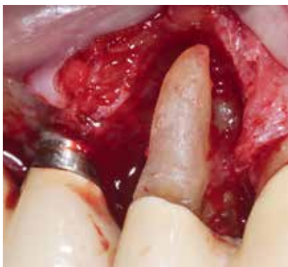
Abb. 4: Defektanatomie nach der Entfernung des Granulationsgewebes.