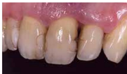
Abb. 11: Ausgangsbefund bei Erstvorstellung. Zahn 21 ist leicht elongiert und deutliche Plaqueablagerungen sind vorhanden. Zudem zeigt sich ein deutlicher Verlust der Interdentalpapille 21/22.

Als initiale Schmerztherapie wurde der Zahn unter Anästhesie kurettiert und ein lokales Antibiotikum (Terracortril) mittels Tamponadenbinde in die Tasche eingebracht.