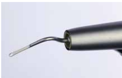
Abb. 15: Das schmale Arbeitsende der Schallspitze SF10T ermöglicht ein präzises Arbeiten auch in sehr tiefen, engwandigen Knochendefekten.