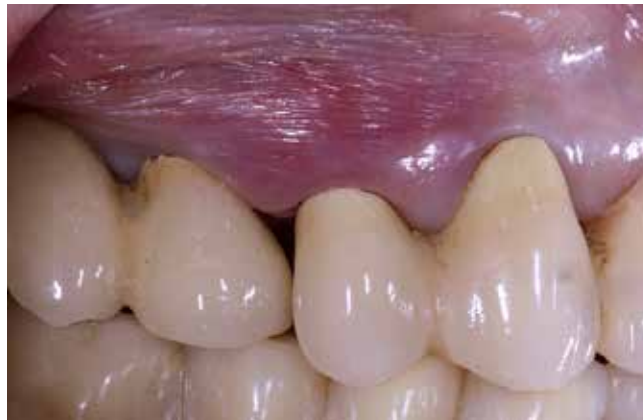
Abb. 1: Im Ausgangsbefund zeigt die Mukosa regio 14, 15 eine Rötung und eine Anschwellung im Interdentalraum 13/14. Distal des Zahnes 14 ist ein deutlicher Verlust der Papille sichtbar.

Eine 67-jährige Patientin wurde für eine parodontale Regenerationstherapie in unsere Praxis überwiesen. Die Anamnese ergab eine Schilddrüsenunterfunktion, welche mit der Einnahme von L-Thyroxin therapiert wurde. Klinisch stellte sich ein restaurativ suffizient versorgtes Gebiss mit einem generalisierten, leichten Attachmentverlust dar. Die Gingiva war weitestgehend entzündungsfrei, wies aber an Zahn 14 und am Implantat 15 eine deutliche Rötung mit interdentaler Anschwellung auf ( Abb. 1 ). Die parodontale Messung ergab stark erhöhte Taschentiefen von bis zu 11 mm an Zahn 14, wohingegen die Messwerte am Implantat 15 mit 4 mm im Normalbereich lagen. Der Befund wurde durch die Röntgendiagnostik bestätigt. Abbildung 2 zeigt den starken vertikalen Knocheneinbruch regio 14 bis zur Wurzelspitze, das Implantat regio 15 hingegen scheint vollständig vom Knochen eingeschleidet zu sein. Die Vitalitätsprobe 14 war zu-