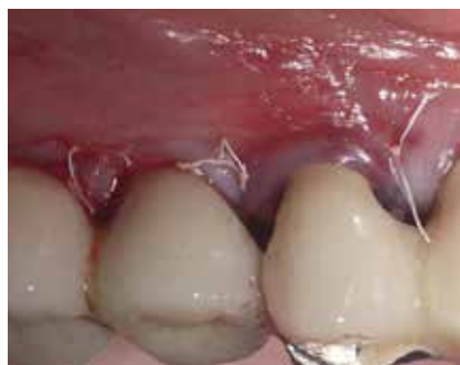
Abb. 9: Suffizienter Wundverschluss nach Augmentation.