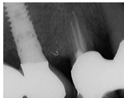
Abb. 10: Röntgenkontrolle postoperativ.