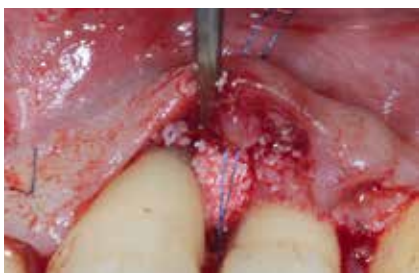
Abb. 17: Augmentation des Knochendefekts mit Knochenersatzmaterialien und Schmelzmatrixproteinen.