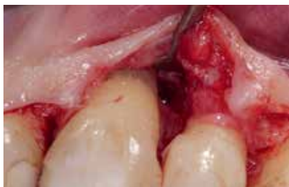
Abb. 16: Defektvolumen nach Entfernung des Granulationsgewebes.