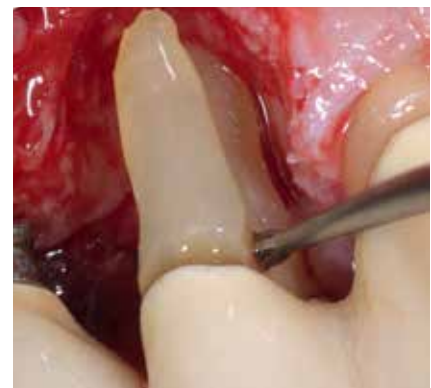
Abb. 6: Sorgfältige Reinigung der bukkalen Wurzel mit Hand- und Schallinstrumenten.