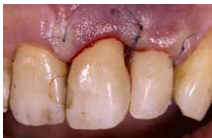
Abb. 18: Wundverschluss mit mikrochirurgischem Nahtmaterial.