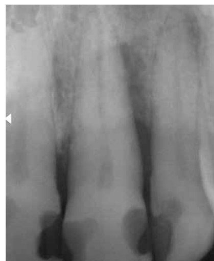
Abb. 12: Röntgenbefund bei Erstvorstellung. Zahn 21 weist distal einen starken vertikalen Knochendefekt bis nahe des Apex auf.