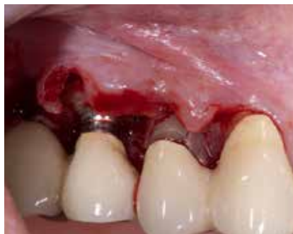
Abb. 3: Schnittführung nach dem Prinzip der Papillenerhaltungstechnik.