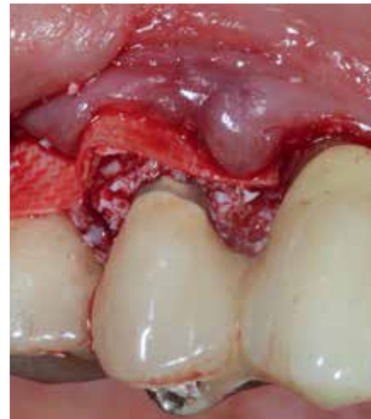
Abb. 8: Augmentation des parodontalen Defekts mit Bio Oss® und einer quervernetzten Kollagenmembran.