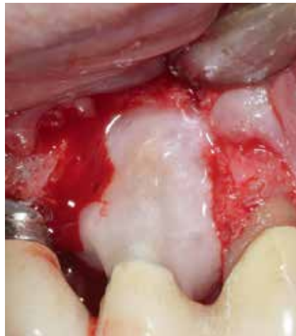
Abb. 7: Dekontamination der Wurzeloberfläche mit Pref-Gel® vor der Applikation der Schmelzmatrixproteine.

Die Patientin wurde angewiesen, den operierten Bereich zwei Wochen lang nicht zu putzen und keine Zahnseide zu verwenden. Eine Oberflächendesinfektion erfolgte 2-mal täglich mit 0,2%igem Chlorhexidin. Zudem wurde die Patientin wöchentlich zur Plaquekontrolle und supragingivalen Politur mit CHX-Gel einbestellt.