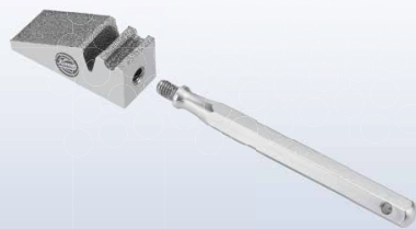
Pierre à dresser