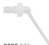
9980.000 EasySeal Endo Tips (20 Stück)