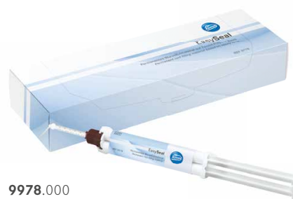
9978.000 EasySeal 9 g Minimix-Spritze

5. Nach Gebrauch Mischkanüle abziehen und EasySeal mit der Verschlusskappe verschließen.